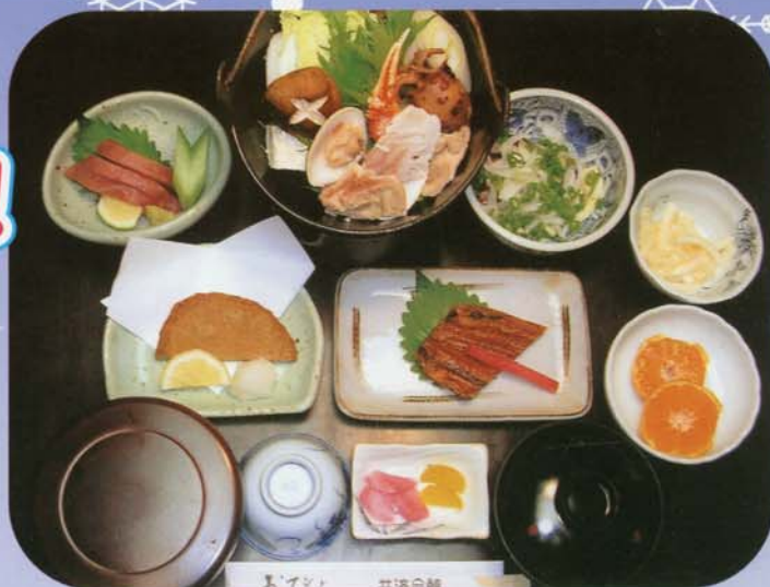
海鮮鍋、刺身、カツオのたたき、焼魚、付出、フルーツ (宿泊セットプランの料理一例)